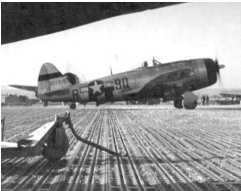
P-47D fra 404th Fighter Squadron, 371st Fighter Group, som var stationeret på flyvepladsen Metz i Frankrig fra den 15. februar til 7. april 1945.

67th FG 7/7 P-38 Attack Blind Bombing Targets 314 x 1000 GP dropped in target area on Wittlich L-3954. NRO. 0 lost. 1035 1150 67th FG 7/7 P-38 Foxhunt 14 x 1000 GP dropped on M/T L-5309. NRO. 0 lost. 1449 1633 367th FG 12/10 P-47 Attack Urberach Storage Area 16 x 500 GP dropped with excellent results. Bombed loco, RR cars. Did not attack Primary target due to weather. 0 lost, 2-0-0-0 (collision) 1340 1633 367th FG 10/9 P-47 Claims: Loco 1-0-0 RR Cars 10-0-0 Gelhausen M/T Depot and A/R 16 x 500 GP dropped on targets. bombed M/Y Leun G-4316, hit loco, RR cars. 0 lost. 1405 1642 367th FG 12/12 P-47 Claims: M/Y 0-0-1 Loco 1-0-0 RR Cars 10-0-0 Attack Supply dump vic Wittlich 24 x 500 GP dropped with excellent results. Bombed buildings, M/T, RR cars, tank. 0 lost. 1340 1605 362nd FG 16/16 P-47 Claims: Tank 1-0-0 M/T 2-0-7 Bldgs 6-0-0 RR Cars 0-0-4 Attack M/Y at Kaiserslautern 24 x 1000 GP dropped on targets. Primary target not attacked due to weather. bombed RR cars in M/Y R-3393, bldgs F-3400, factory M-4504, cut tracks. 0 lost. 1500 1700 Claims: Bldgs 4-0-0 RR Cars 10-0-0 Tracks cut 6 Factory 0-0-1