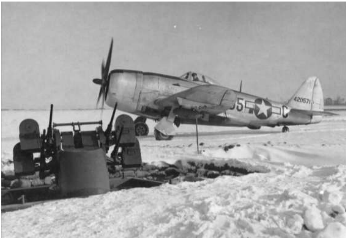
P-47D fra 386th Fighter Squadron, 365th Fighter Group. Billedet er taget under Slaget om Ardennerne, da 'Hell Hawks' gjorde sig særligt udmærket i angreb på tyske jordstyrker. Bemærk 12.7 mm firling til venstre i billedet, som var et effektivt forsvar mod lavangreb.

48th FG 36/36 P-47 0 lost, 0-0-0-1 (flak) Co-op 3rd Arm/Div (3 missions) 0720 0934 (2 missions) 0803 1047 (2 missions) 0905 1138 68 x 500 GP, 4 x Napalms on 10 barges F-4749; factory and rails F-4256, NRO; M/Y Adernach F-7695, NRO, barge same area strafed, dam; M/Y F-5665, hit cars and adjoining town, NRO; factory F-3975, obs hits; trains in area, headed S and W. Also strafed 3 Me 262 made pass at flight 1005 hrs, 7000 ft F-2063. No engagement. Claims: RR Cars 16-0-21 Barges 1-0-1 Railcuts 2 Locos 0-0-1 Factory 0-0-1 M/Y 0-0-1 0 lost. 365th FG 36/36 P-47 Co-op 3rd Arm/Div (3 missions) 1013 1353 (3 missions) 1230 1502 56 x 500 GP on M/Y F-5166, Bonn F-5538, NRO; barges F-3777, NRO; town Weidenfeld F-2267; M/Y F-8250; M/Y F-4971, NRO; M/Y and town F-9942; also strafed town; M/T in area. Claims: RR Cars 23-0-16 M/Y 0-0-1 Locos 2-1-1 M/T 1-0-3 Hwy Cuts 1 Bldgs 8-0-0 Tanks 1-0-0 0 lost, 0-0-1-1 (flak)