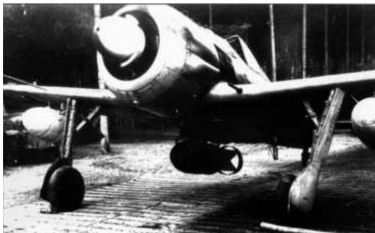
Fw 190 fra Nachtschlachtgruppe 20. Under kroppen medfører flyet en 500 kg sprængbombe og under vingerne to droptanke.