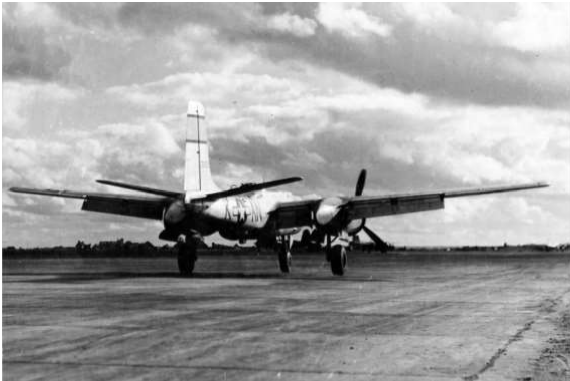
A-26B fra 553rd Bomb Squadron, 386th Bomb Group, der var stationeret på flyvepladsen Beaumont.

Box I & II - DMPI - Fair. About 30% of all bombs within 1000 ft radius om DMPI. Bursts of Box I occur in a concentrated pattern centered 1000 ft SE of DMPI. Possible hits or near misses on main N-S highway running through town, and hits on a secondary N-S road on the west edge of town. Pattern blankets about 15 residential type buildings in the south end of target area. Split pattern of Box II bombs is in a field 2000 ft south of DMPI.