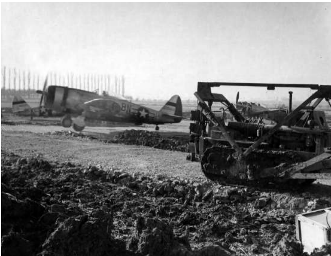
P-47 fra 371st Fighter Group, der i marts 1945 opererede fra flyvepladsen Metz i Frankrig. Den 2. marts angreb 371st FG blandt andet banegården og et depot for motorkøretøjer ved Ulmen, hvor man hævdede at have beskadiget tre kampvogne samt ødelagt to jernbanevogne og yderligere beskadiget fem.

371st FG 15/15 P-47 Oil Storage Tank M-720691 0836 1015 30 x 500 GP dropped with excellent results. Bombed bldg, fuel dump at primary target. 0 lost. Claims: Bldg 0-0-1 F/ Dump 0-0-1 371st FG 4/4 P-47 Leaflet Mission 0959 1121 28 Leaflet bombs dropped at following places: Dudlich-Fohren-Salmrohr-Ittlich. Strafed and dam M/T. 0 lost. Claims: M/T 0-0-2 371st FG 32/32 P-47 Co-op XX Corps (3 missions) 1203 1345 (2 missions) 1302 1445 (2 missions) 1418 1534 (1 mission) 1357 1539 21 x 500 GP, 12 x 500 RDX, 45 x 260 Frags dropped on targets. Bombed RR crs, loco, tanks and cut rails in area. 0 lost. Claims: M/T 5-0-6 Tanks 4-0-3 M/Y 0-0-1 RR Cars 16-0-34 Locos 0-0-1 Rail Cuts 2 371st FG 8/8 P-47 Covoy M/T Depot 1434 1632 7 x 500 GP, 8 x 500 RDX dropped on targets. Bombed tanks, RR crs and M/Y L-4580. 0 lost. Claims: Tanks 0-0-3 RR Cars 2-0-5 M/Y 0-0-1