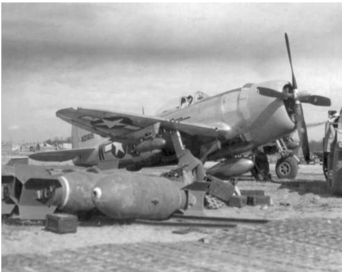
P-47D fra 23rd Fighter Squadron, 36th Fighter Group, der fra den 23. oktober 1944 og frem til den 28. marts 1945 var stationeret på flyvepladsen Le Culot i Belgien.

(2 missions) 1540 1820 93 x 500 GP on targets in area. 0 lost. Claims: Gun pos 1-0-12 Railcuts 1 RR Cars 3-0-4 M/Y 0-0-2 Locos 1-0-1 Bldgs 3-0-4 Factory 0-0-1 A/V 3-0-0 M/T 17-0-0 HDV 2-0-0 Tanks 0-0-1 Barges 2-0-6 Supply/D 0-0-1 Steamboats 0-0-2 Dock 1-0-1 36th FG 12/12 P-47 A/R E Rhine 1430 1635 24 x 500 GP on Bonn F-7010, Bruhl-Rheinbrohl, large depot and RR siding. 0 lost. Claims: Barges 4-0-2 RR Cars 2-0-0 Railcuts 1