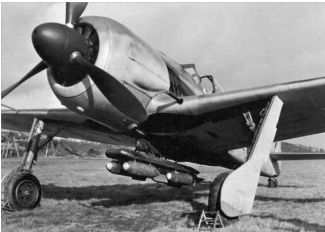
Fw 190A-4/U3 med ETC 500, hvor der er placeret fire stk SC 50 sprængbomber. I foråret 1945 havde de allierede luftherredømmet, men kunne ikke helt forhindre, at tyske fly foretog mindre bombeangreb. De amerikanske og britiske hærstyrker overholdt ofte ikke mørklægningsbestemmelserne og det udnyttede de tyske Nachtschlachtgruppen, hvor man med få fly forårsagede stor opstandelse blandt de allierede soldater. Skaderne var dog ofte begrænsede.