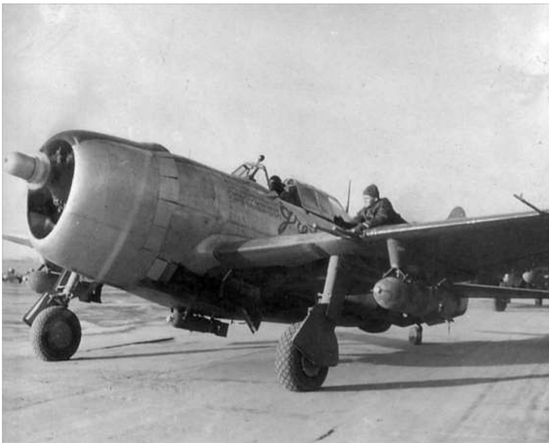
P-47D bevæbnet med en 500 lb sprængbombe under hver vinge samt en 260 lb fragmentationsbombe under kroppen.

Claims: RR Cars 0-0-11 M/T 2-0-0 Locos 1-0-2 422nd FS 3/3 A-20 Hondorf (F-2709) 12 x 500 GP on target, NRO. 0 lost. 2120 0535 422nd FS 2/2 A-20 Kreuzweingarten (F-330242) 8 x 500 GP on target, small fires. 0 lost. 2205 0242 422nd FS 3/3 A-20 Ivarshein (F-319210) 12 x 500 GP on target. Results not given. 0 lost. 2244 0528 422nd FS 2/2 A-20 Eischersheid (F-314155) 8 x 500 GP on target. Results not given. 0 lost. 2349 0628 422nd FS 4/3 P-61 Scramble 8 GCI chases, 6 AI contacts, 2 visual - identified as 2 Ju 87s, 1 Me 110, alt 6.500 ft. Me 110 dam F-2467 0450 hrs. Ju 87 des F-4017, 5.050 ft at 0457 hrs. Ju 87 des F-4017, 5050 ft at 0457 hrs. Ju 87 prob des F-3062, 0506 hrs 5500 ft AI contact 2 miles on last visual contact 1000-1400 ft. 0128 0554 Claims: E/A (air) 1-1-1 0 lost, 0-0-01 (unknown) 48th FG 16/16 P-47 A/R S IX TAC Area (2 missions) 32 x 500 GP, 16 x 260 Frags on M/Y F-4643; M/T F-4541 heading W. 0 lost, 0-0-0-1 (flak). 0738 0930 Claims: RR Cars 8-0-10 M/T 8-0-4