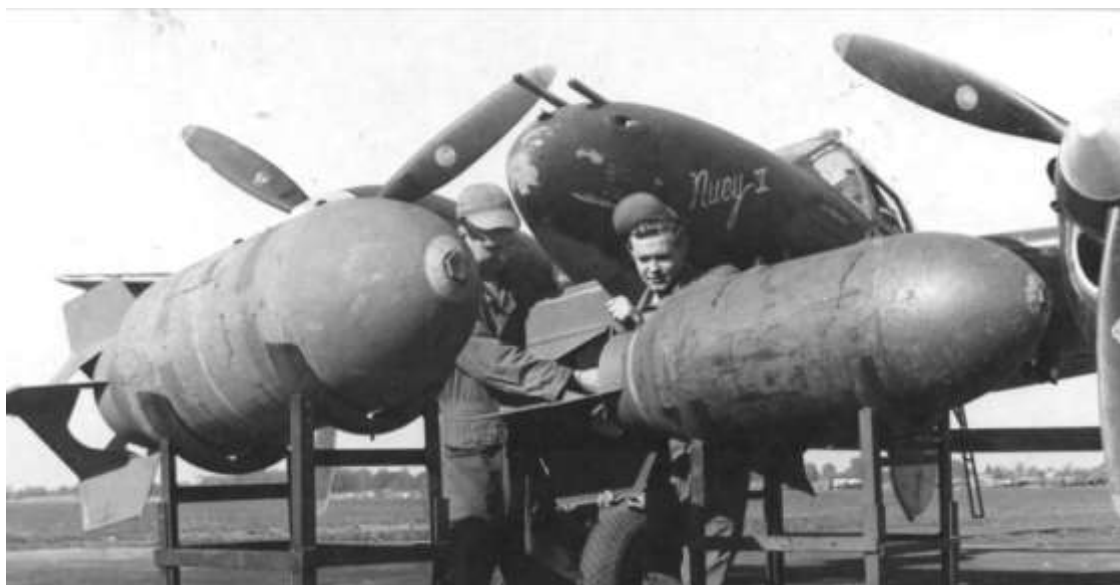
P-38 med to stk 1000 lb sprængbomber.

Clark fra 111th Tactical Reconnaissance Squadron gjorde krav på at have nedskudt en Bf 109 mellem Pforzheim og Karlsruhe klokken 08.50. Endelig gjorde 1/Lt Van S Brokaw fra 111st Tactical Reconnaissance Squadron krav på at have nedskudt en Bf 109 ved Karlsruhe klokken 09.25.