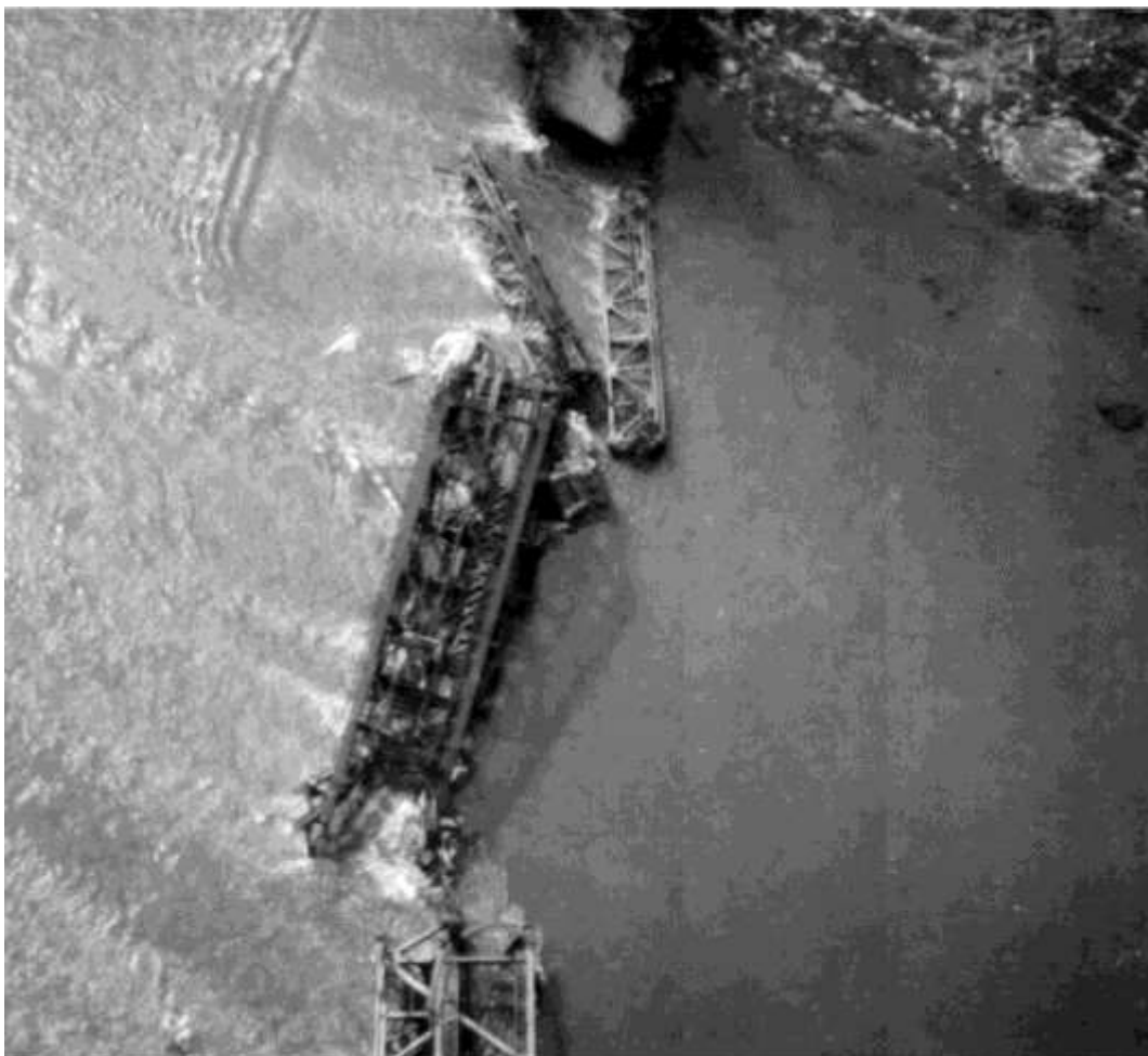
Den ødelagte jernbanebro ved Eller fotograferet i maj 1945. Fold3)

Eller Rail Bridge 0934 1041 1205 (L-572671) 27 x 2000 GP, 4 x 500 GP dropped on target with unobserved results. 0 lost. 19 a/c dispatched (including 1 PFF) 15 dropping 27 x 2000, 4 x 500 GP on Primary. 3 window a/c. 1 a/c failed to bomb; mechanical failure. No losses, damage, casualties. PFF called ripsaw and obtained fix 5 minutes after entering tactical area. Bombing by box on PFF lead from 12.800 ft. No photo coverage or visual observation of results due to cloud cover.