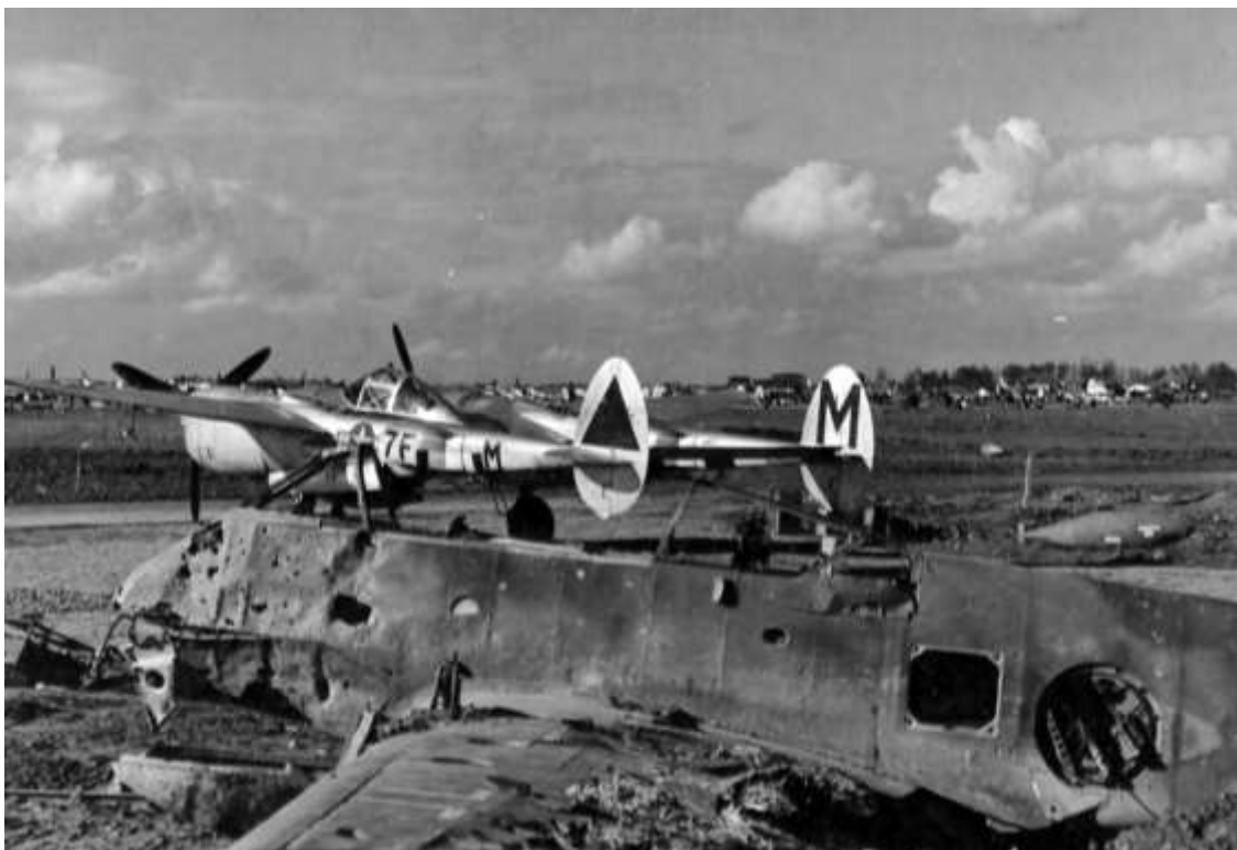
P-38J fra 485th Fighter Squadron, 370th Fighter Group, på Florennes/Juzaines i Belgien. I marts 1945 var enheden flyttet til flyvepladsen Zwartberg, der ligeledes lå i Belgien. I februar 1945 begyndte 370th FG at konvertere på P-51, men fløj stadigvæk missioner med P-38J.

406th FG 58/57 P-47 Co-op XIX Corps (1 mission) 1050 1250 (2 missions) 1330 1550 (2 missions) 1450 1710 (2 missions) 1615 1815 112 x 500 GP, 56 x 260 Frags on gun pos F-2279, des bldgs, started fries; M/Y F-3700 hit cars, loco; gun pos vic Düsseldorf, NRO; gun pos SE town F-2604; factory F-4087, NRO; M/T, rail targets, buildings in area. 0 lost. Claims: Gun pos 10-0-0 RR Cars 76-0-4 M/Y 0-0-1 Hwy Cuts 2 Locos 2-0-1 Bldgs 27-0-0 M/T 7-0-8 370th FG 21/21 P-38 Escort Mediums (2 missions) 1000 1310 Uneventful escort. 1 Sq made no contact with bombers. 0 lost. 370th FG 23/21 P-38 A/R Hamm - Brilon - Olpe Area 1443 1729 21 x 500 GP on rail targets and bldgs in area; church N-1257 Lanfach, exploding violently, believed ammo dump, many fires. Strafed A/V, tanks and troops N-2940, N-3440, NRO. 0 lost, 0-0-0-1 (flak) Claims: Locos 1-0-2 Bldgs 10-0-0 Ammo/D 1-0-0 RR Cars 0-9-6