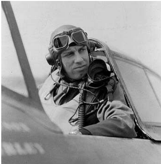
Oberst Bingham T Kleine, der var chef for 371st Fighter Group indtil indtil september 1945.

371st FG 8/8 P-47 Co-op XX Corps (2 missions) 1706 1811 12 x 500 GP, 6 x 260 Frags on targets. Bombed M/T, cut hwy in area. 0 lost. Claims: Hwy Cut 1 M/T 1-0-4