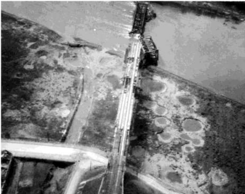
Jernbanebroen ved Eller.

Box II - PFF - Unsatisfactory. All bombs more than 1000 ft from DMPI. Split pattern, with one large concentration hitting about 1800 ft E of DMPI across the end of M/Y and on roundhouse, and main roadway. two small patterns fell 1900 ft SSW of DMPI in open fields.