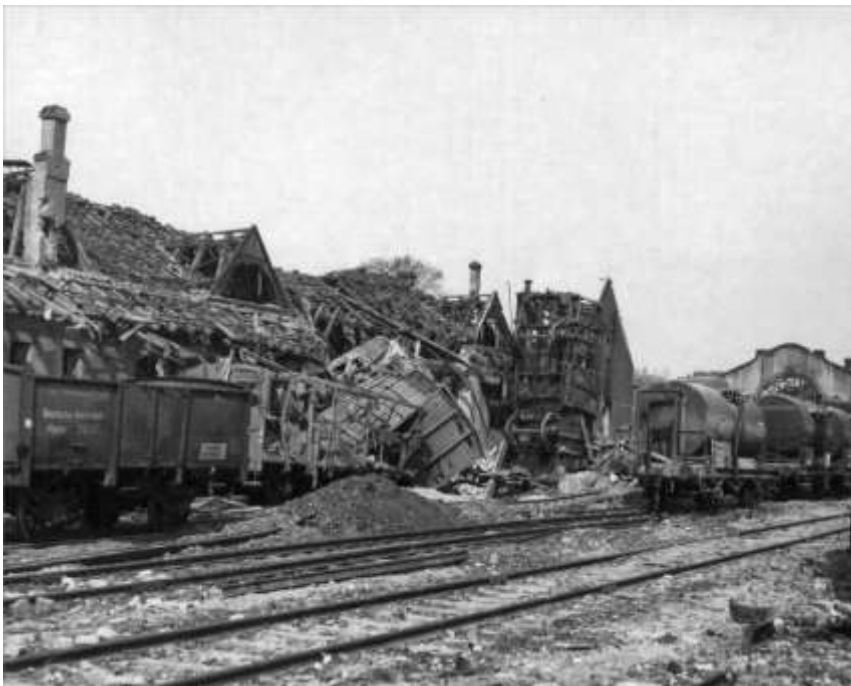
Ødelagte bygninger langs jernbanen i Wiesbaden.

Box II - DMPI - Undetermined. No photo coverage or visual observation of results of any of the 3 flights in this box.