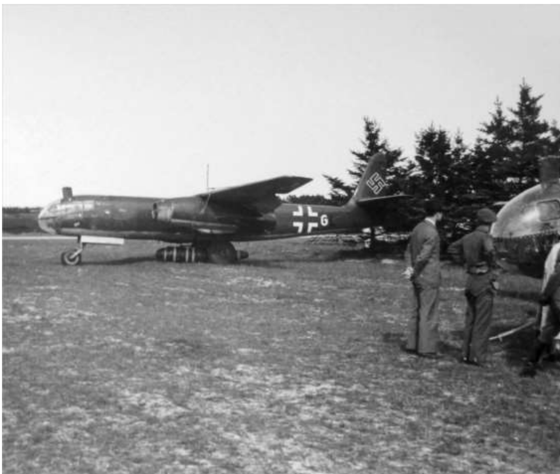
Ar 234 på Fliegerhorst Grove efter krigens afslutning. Ar 234 var i 1944/45 det perfekte reccefly med stor hastighed og flyvehøjde. (Tillisch/RDAF)

Ud over 1./F123 var Einsatzkommando 1.(F)/5 på Stavanger i Sydvestnorge i stand til at foretage opklaring over England. Den 26. februar rapporterede Luftwaffe, at jordpersonellet til gennemførelse af sådanne operationer var til stede på Stavanger og at der tillige var en enkelt Ar 234 på Stavanger. Yderligere to Ar 234 var på vej til Stavanger, men at de på grund af dårligt vejr og fjendesituationen var mellemlandet på Grove i Jylland. De ville dog fortsætte til Stavanger, så snart forholdene tillod dette.