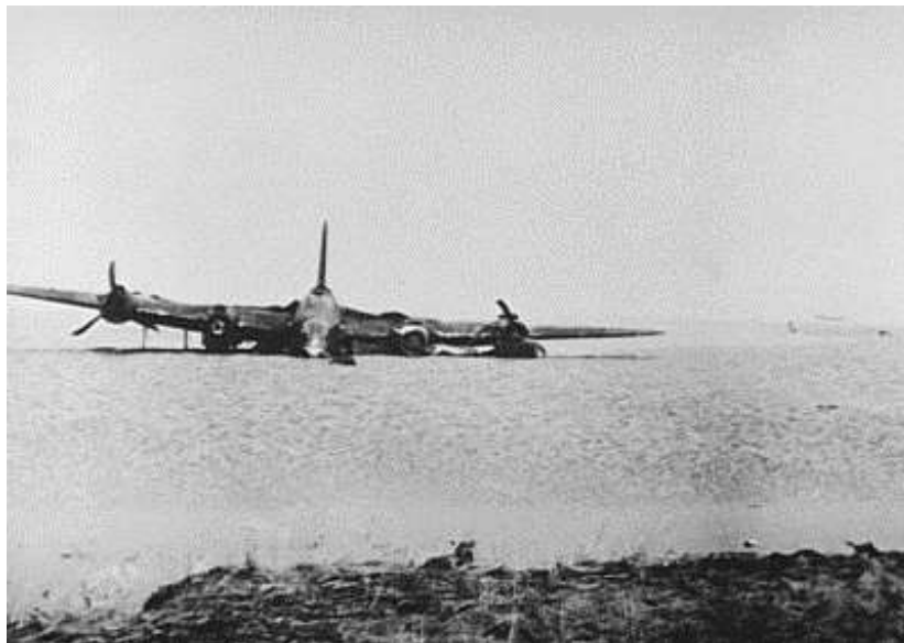
Stirling IV LJ9999 fra No. 138 Squadron, der nødlandede i den sydlige ende af Ringkøbing Fjord på meget lavt vand ud for Tippepold. (Flensted)

vejen hjem var man nået til Ringkøbing Fjord i 50 fods højde, da man blev beskydt af en byge 20 mm flak fra en kanonstilling ved Stauning. Steven mistede kontrollen over højderoret og Stirlingen ramte havoverfladen i en lav vinkel. Alle i besætningen overlevede nedstyrtningen og var ualmindelige heldige at slippe fra en ukontrolleret nødlanding med 230 miles i timen. Under sammenstødet med vandoverfladen blev navigatøren F/O Tilly kastet ud af sit sæde med en sådan kraft, at han mistede sine støvler. Besætningen troede i første omgang, at de befandt sig ude over Nordsøen og blev meget overraskede, at de kunne bunde, da de forlod flyet. De befandt sig i den sydlige ende af Ringkøbing Fjord ved Tippepold, der er meget lavvandet.