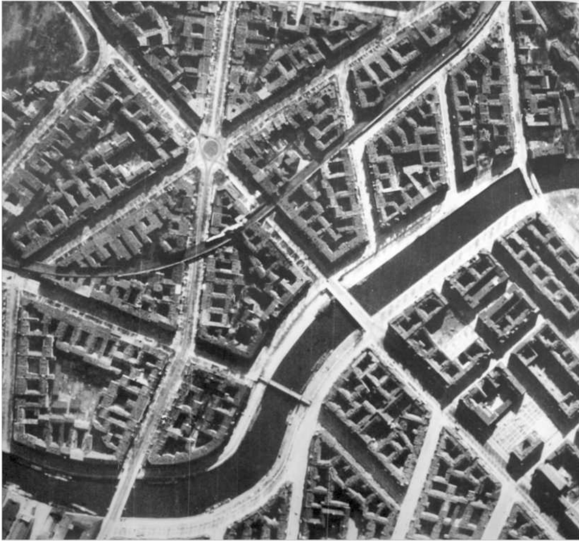
Beboelseskvarterer i Berlin før RAF påbegyndte deres bombeoffensiv mod byen.