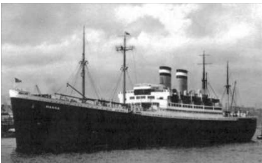
Hansa på 22.117 brt, der havde tilhørt HAPA, men som siden krigens begyndelse havde fungeret som beboelseskib for 2. U-bootslehrdivision og senere som flygtningeskib.

Den 2. marts klokken 12.45 detonerede en mine midtskibs ved U-3519, da ubåden befandt sig nord for Warnemünde i minelægningsområdet 'Sweet Pea I'. U-3519, der var af typen XXI, var på vej fra Travemünde til Warnemünde, da den blev minesprængt klokken 12.45 ca 500 meter nordvest for Ansteuerungstonne Warnemünde. U-3519 forlod af en eller anden grund den minestrøgne sejlroute og kom umiddelbart herefter ud for den første minedetonation, der hurtigt blev efterfulgt af yderligere en. Der var 65