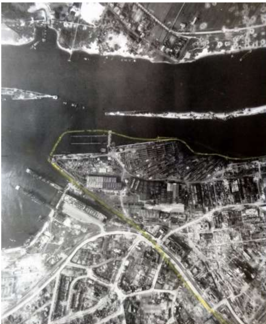
Britisk fotografi af skibsværft i Bremen, Den gule markering viser omfanget af væftet.