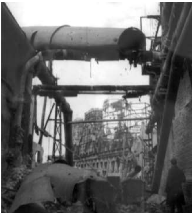
Ødelagt kraftværk, der var en del af Krupp i Essen.

Mosquito XV ML941 F/O R F Grain & W/O W Young 00.25 - 03.56 Bombed glow of 2nd TI - burst in cloud and disappeared quickly - bombing fairly concentrated around Red glow - No opposition - 1 x 4000.