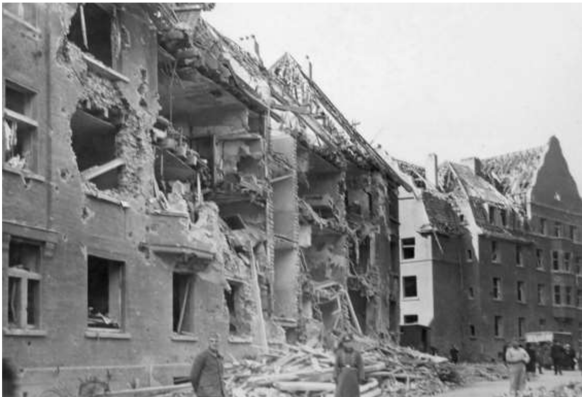
Münchenerstrasse 163-167 i Essen, der blev kraftigt beskadiget af sprængbomber.

Mosquito XVI PF415 F/Lt Hutchinson & F/O Bird 00.16 - 04.06 When running up on Gee very faint glow seen, coincided with Gee, so believed Red TI. 2 cookie bursts seen at 0232. 9/10ths 9000' approx.