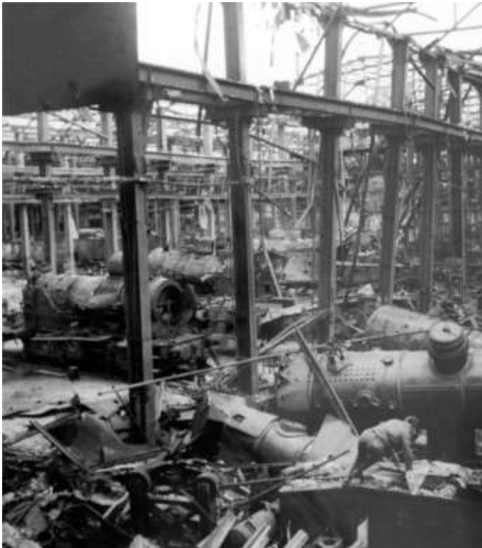
Ødelagt fabrikshal med lokomotiver i Essen.