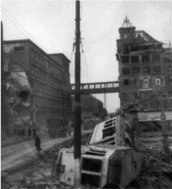
Ødelagte eller svært beskadigede kontorbygninger tilhørende Krupp i Essen samt væltede sporvogne, der er blevet ødelagt af kraftige bombetonationer.

Essen blev angrebet af følgende Mosquitobesætninger: