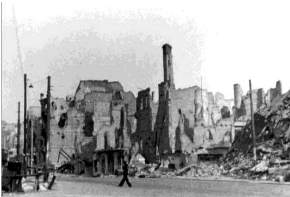
Typisk gadebilled i den centrale del af Berlin i 1945.

3 Gefallene und 1 Schwerverwundeter (nur Männer). 600 Obdachlose bzw Umquartierte.