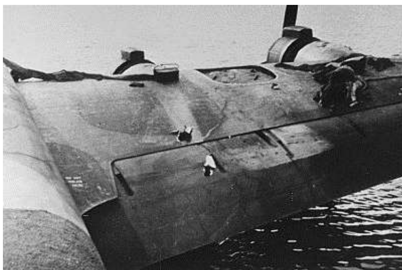
Skader på Stirling LJ999 fra 20 mm beskydningen fra Stauning. Skuddene er gået næsten lodret op gennem vingen og må være blevet affyret på meget kort hold.