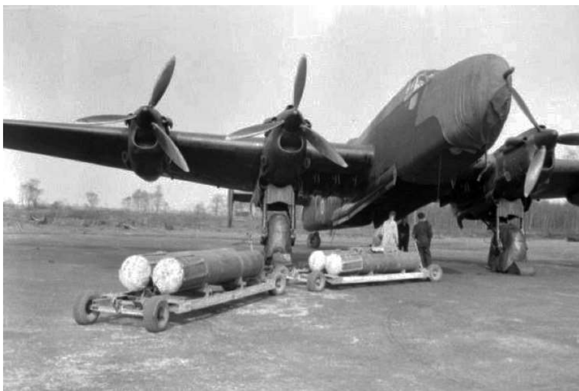
Halifax V fra No. 77 Squadron i færd med at blive læsset med fire miner. Natten mellem den 4. og 5 marts 1945 udlagde Halifaxflyene fra No. 4 Group hovedsageligt 1850 lbs Mk VI miner.

Hvordan så det så ud fra allieret side ? Om aftenen den 4. marts 1945 afsendte No. 4 Group 12 fly for at lægge miner i Rosemary (Helgolandsbugten). H-hour for minelægningen i Rosemary var sat til klokken 19.58. Seks fly fra No. 10 Squadron på RAF Melbourne og seks fly fra No. 78 Squadron på RAF Brighton gennemførte operationen uden problemer. Minerne (32 stk 1500 lbs og 16 stk 1850 lbs) blev udlagt ved hjælp af H2S og bortset fra let luftværnsskydning fra Helgoland, forløb flyvningerne uden dramatiske optrin. Alle flyene returnerede til deres baser.