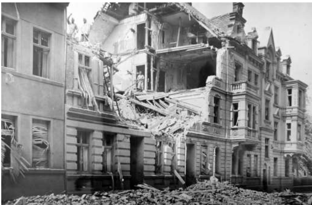
Ødelagt første og anden sal i Sachsenstrasse 13 i Essen efter at en bombe har detoneret i gaden foran bygningen.

Mosquito XVI RV318 W/Cdr B S Jones & F/Lt J E Earnshaw 00.20 - 03.48 Mosquito XVI MM176 F/Lt G R Green & F/Lt J A Perry 00.21 - 03.50 Mosquito XVI PF450 F/Lt L W Harker & F/O F E Melbourne 00.20 - 03.52