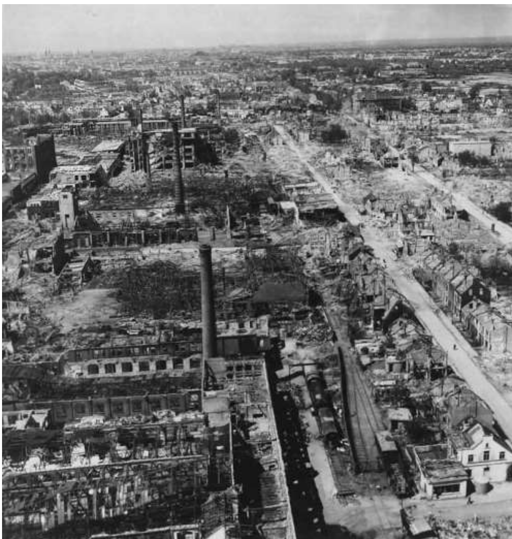
Hastedt Hemelingen Borgward Werke i Bremen i 1945, som fremstillede dele for Focke Wulf.

Tilbage var et par andre foranstaltninger, nemlig støjsendere mod Oboe udstyret, anti-Mosquito natjagere af typen TA 154 og Me 262 samt bedre luftværnsskyts end det, der var indsat. I slutningen af februar bad Oberkommando der Marine Luftwaffe om at opstille to støjsendere vest for Bremen for at forstyrre Oboe. Støjsenderne skulle være klar i løbet af otte dage, men virkningen af støjsenderne var kun begrænset. Heller ikke bedre luftværnsskyts, der kunne beskyde mål i 9 - 11.000 meters højde, kunne fremskaffes og natjagere af typen Me 262 kom heller ikke på vingerne i nævneværdig grad.