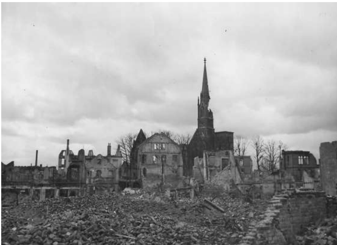
Den ødelagte indre by i Bremen med det beskadigede tårn på Stephanskirche i baggrunden. Kirken var blevet ramt af bomber i december 1943 og august 1944 samt yderligere beskadiget i februar 1945.

Bremen 02.04 - 02.14 Uhr: 3 Minenbomben auf Hafengebiet. 2 Grossbrände. Eine Anzahl Flakbuden total, desgl. Hohlkörperfabrik und 1 Uferkran. Sauerstoff- und Wasserstofffabrik schwer, eine Anzahl weiterer Gebäude mittel und Bollwerk leicht. Geringe glasschäden an einer Getreideanlage. Keine Personenverluste.