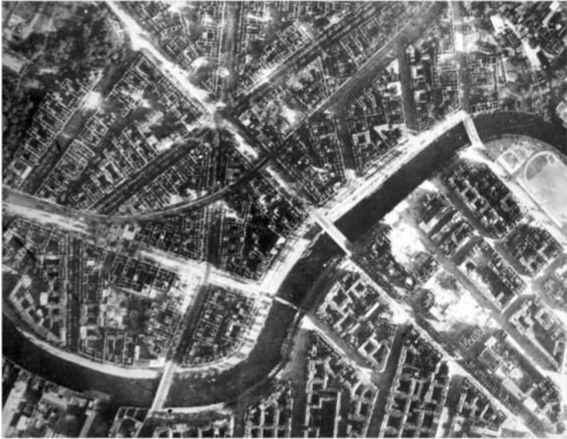
Det samme kvarter i Berlin i 1945. Hovedparten af bygningerne er udbændte og de øvrige beskadigede i større eller mindre grad. De tilbageblevne indbyggere levede under kummerlige forhold, som man dårlig nok kan forestille sig i dag.