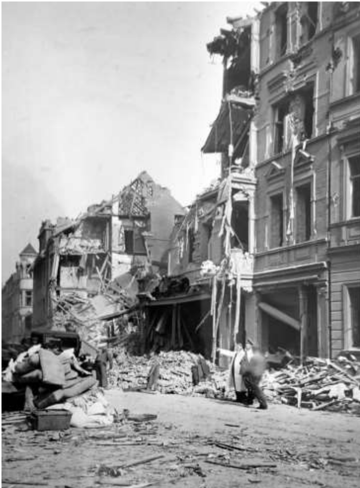
Beskadigede bygninger i Essen. Øverst ses bagsiden af bygningerne i Bramkamp Strasse. Nederst ses Thomae Strasse 250-256, der blev ramt af tre sprængbomber.