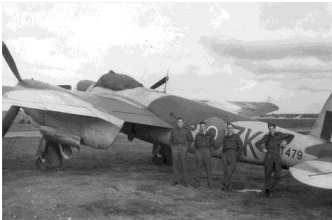
Mosquito NF 30 NT479 fra No. 25 Squadron, der var hjemmehørende på RAF Castle Camps. Eskadrillen konverterede i september 1944 fra Mosquito NF XVII til NF 30 og udskiftningen var tilendebragt i november samme år.

Begge patruljer forløb uden hændelser til trods for eskadrillens motto 'We kill by night'.